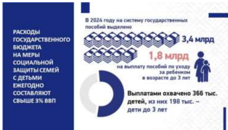
Слайд 12. Выделение государственных пособий семьям

В нее входят, как мы видим, государственные пособия при рождении и воспитании, семейный капитал, социальная помощь и соцслужги, гарантии в различных сферах и др.